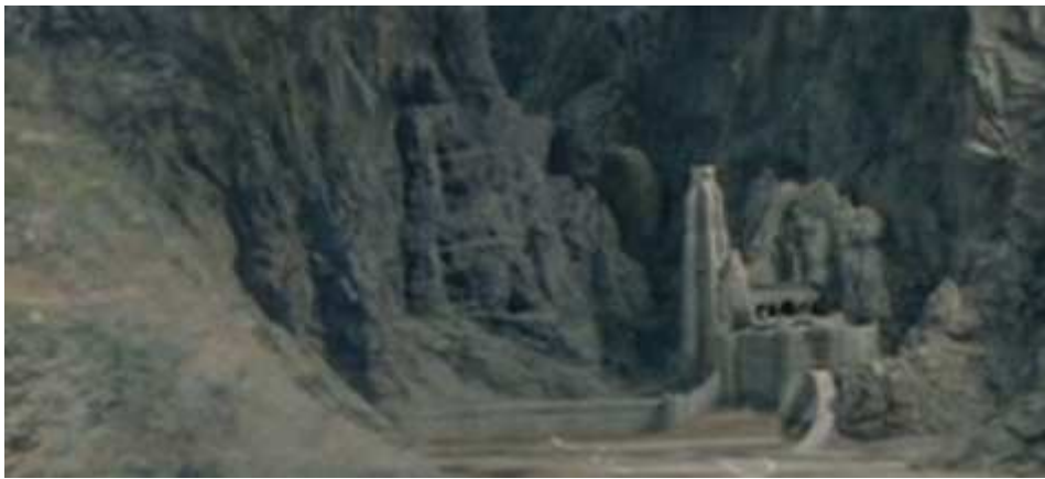
Ningún ejercito ha penetrado nuestras defensas, ni puesto el pie en Cuernavilla

De camino a Cuernavilla, Galenthed y el resto de viajeros dirigidos por Dirheln sufren una emboscada por la noche de los orcos que merodean cerca de las montañas. Muchos perecen en la escaramuza pero finalmente los valientes aldeanos logran la victoria.